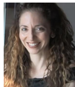
Ασημίνα Προέδρου Σκηνοθέτης | Ελλάδα