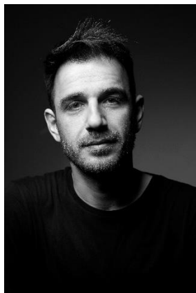
Erenik Beqiri Σκηνοθέτης | Αλβανία